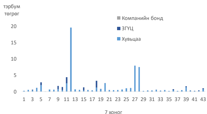
Эх сурвалж: Монголын хөрөнгийн бирж